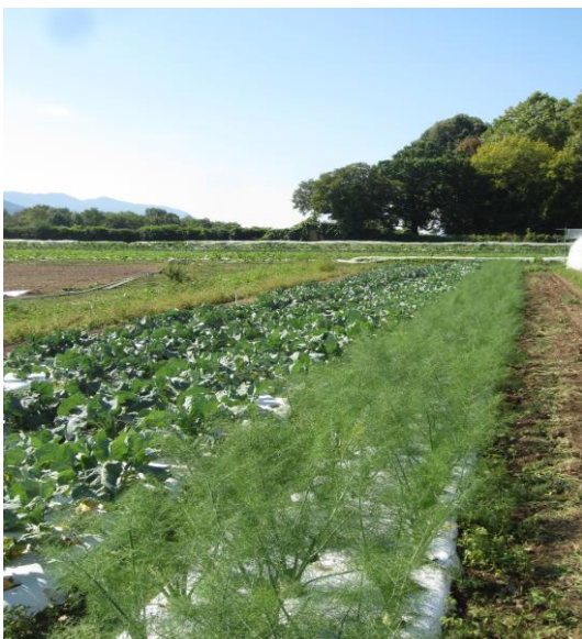
Planche de fenouil

Nous avons donc décidé de faire un labour afin d'obtenir une meilleure profondeur de sol travaillé et utilisable par le système racinaire de la culture. La reprise de ce labour a été faite à la rotobèche dans le but d'obtenir une structure assez fine pour le semis du couvert végétal.