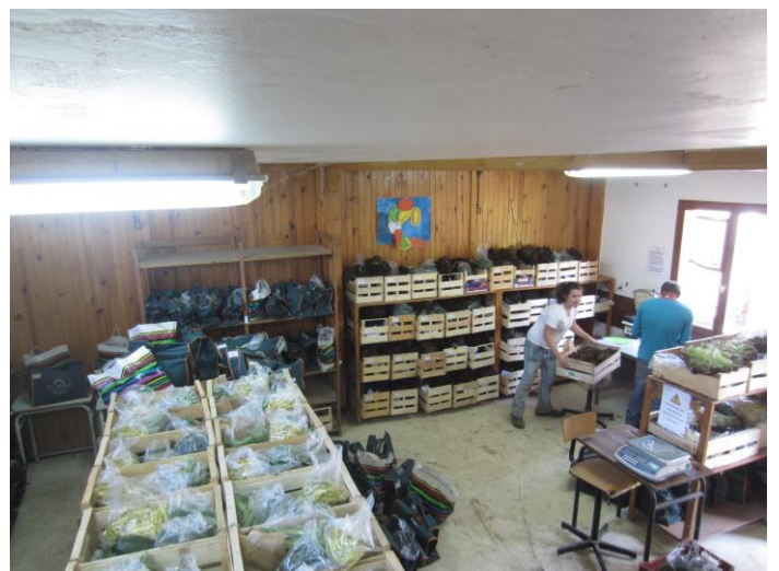
Préparation des paniers