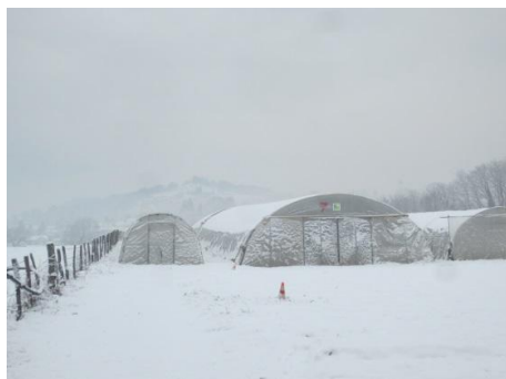
Serres blanches pleines de légumes verts sur une photo en noir et blanc !