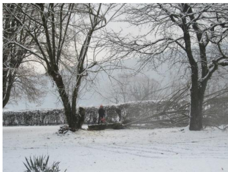
Entretien du parc