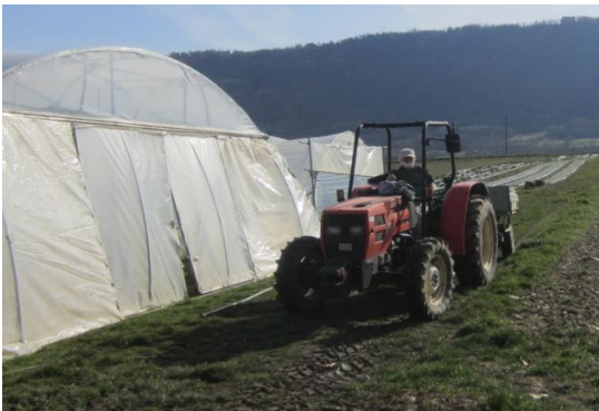
Bruno transporte les cagettes sur la remorque