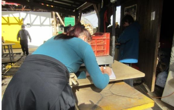
Chaque pesée de légumes est notée