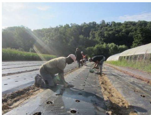
Les plants de fraisiers sont chouchoutés. La terre est travaillée pour les accueillir pour une reprise réussie.