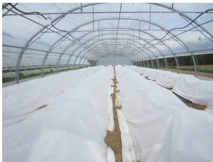
et sous les 3 couches de voile P30.

Protégés du gel, mais aussi du vent, la reprise a été très bonne. Les premières fleurs sont même visibles depuis quelques jours. Si la pollinisation se fait correctement, les premières tomates devraient être plus précoces.