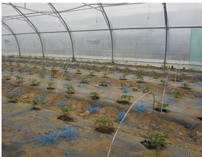
Plants repiqués avec leurs tuteurs-ficelle bleus sous arceaux

La période de gel critique est maintenant passée et le voile isotherme mis en place par les équipes a très bien fonctionné. Des arceaux ont permis de soutenir les trois épaisseurs du voile isolant sans toucher les jeunes plants et risquer de les endommager.